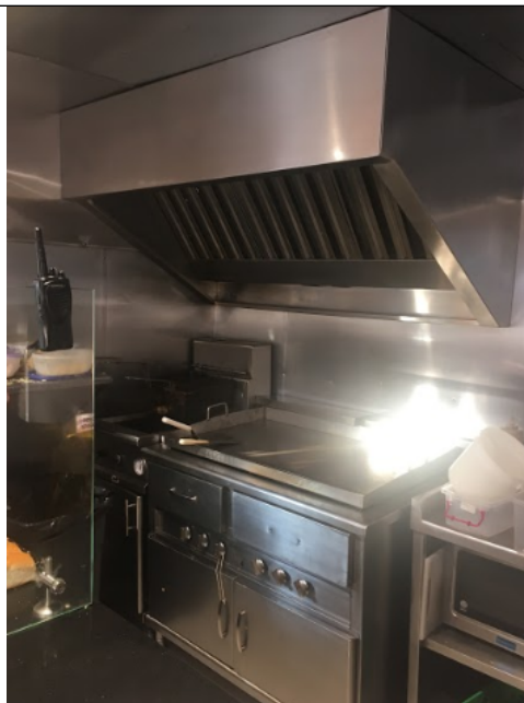
Fotografía N° 3 Área de cocción