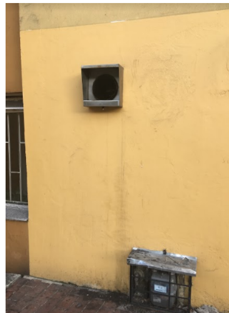
Fotografía N°. 4 Ducto de salida sistema de extracción