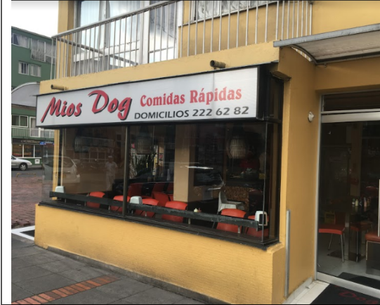
Fotografía N°. 1 Fachada del predio.