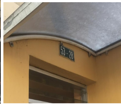
Fotografía N°. 2 Nomenclatura Urbana del predio